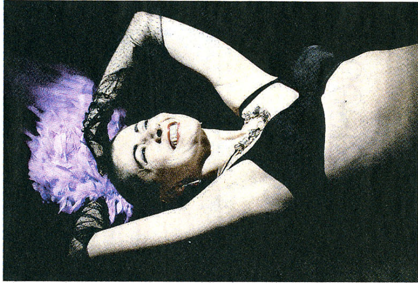
Spogliarello nel «Duca delle prugne» in scena a Bologna

va nel coinvolgimento del pubblico, chiamato in causa in continuazione come certo a teatro non succede quasi mai, e comunque più ancora di quanto succedeva nei night, dove la cantante poteva scendere nella sala e passare il boa intorno al collo dei clienti. Qui i membri femminili della compagnia quando non impegnati nei loro numeri fungono da cameriere, siedono con gli avventori, e a richiesta eseguono persino coccole e piccoli massaggi rilassanti per la cervicale; tutti extra da pagare, vedi il titolo, in prugne, ossia spuntando i simboli su una cartella che si acquista entrando. A forza di